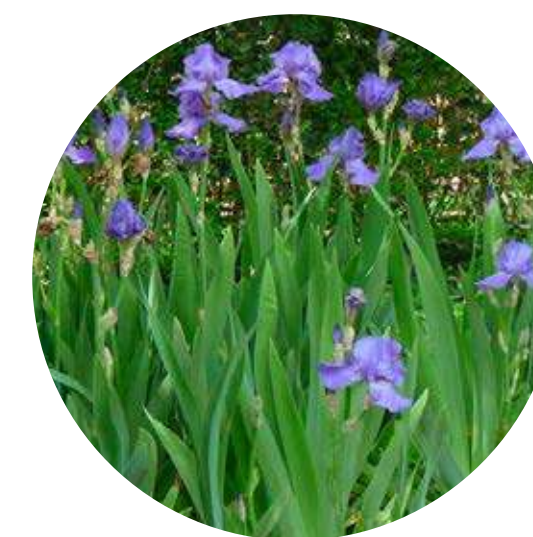
LIRIO IRIS GERMANICA