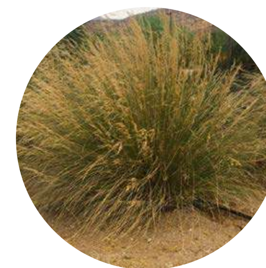
STIPA STIPA CAUDATA