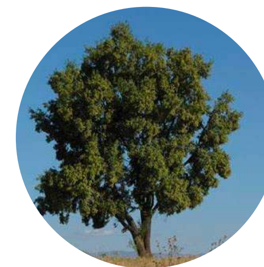
QUILLAY QUILLAJA SAPONARIA