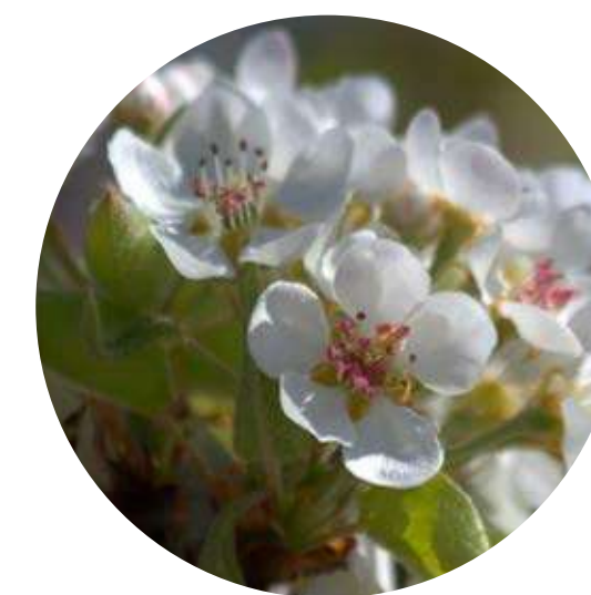
PERAL DE FLOR PYRUS CALLERYANA