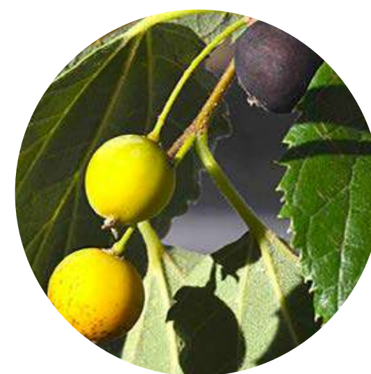
ALMEZ CELTIS AUSTRALIS