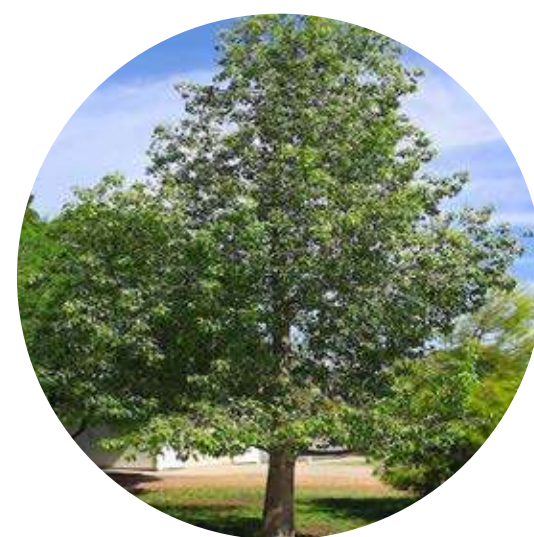
BRACHICHITO BRACHYCHITON POPULNEUS

Especies de bajo consumo y endémicas de la zona