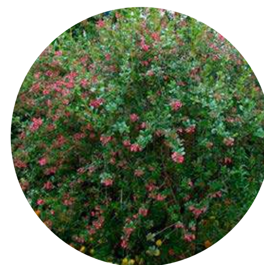
ESCALONIA ESCALLONIA RUBRA