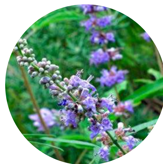
SAUZGATILLO VITEX AGNUS-CASTUS